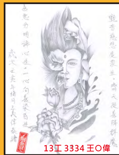
13工 3334 王○偉