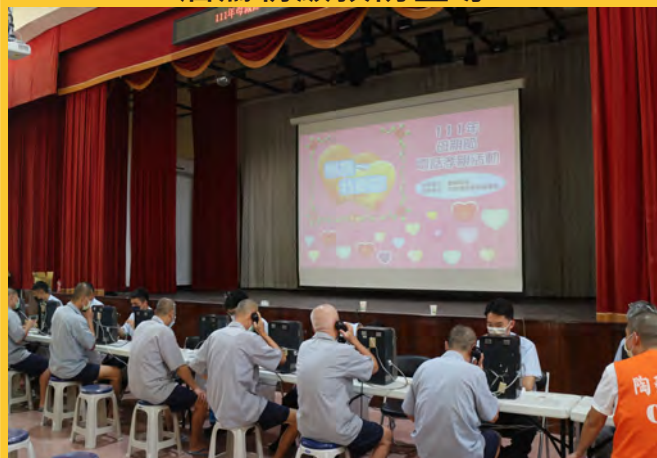
111年母親節收容人電話孝親活動