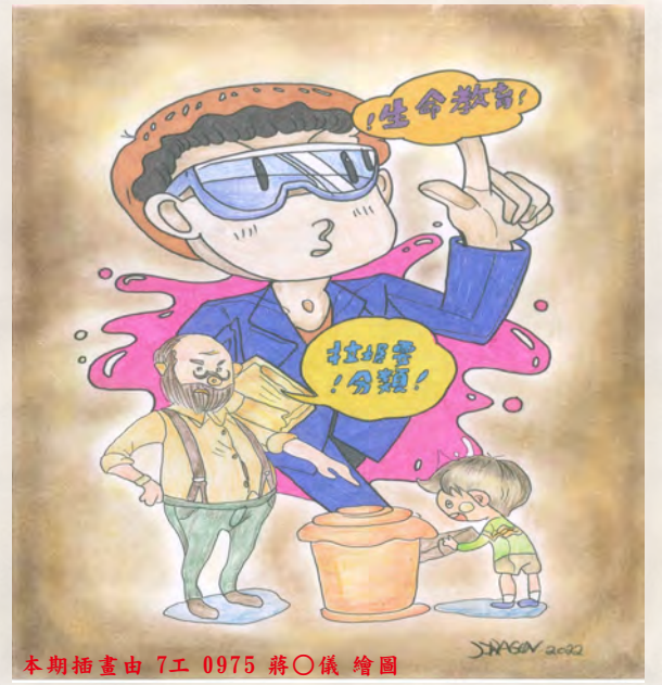
本期插畫由 7工 0975 蔣○儀 繪圖

丟棄即垃圾，回收變黃金、唯有痛定思痛，壯士斷腕的揮別荒誕不經的過去，經過一次次的淬鍊和考驗，才能像鳳凰浴火重生。