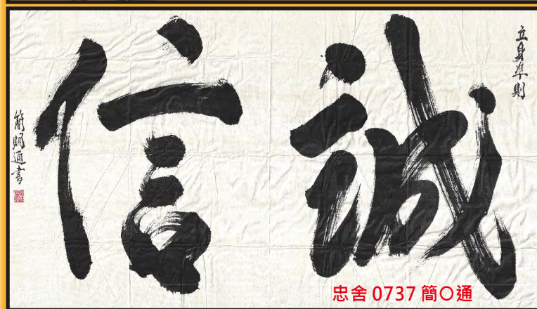
忠舍 0737 簡○通