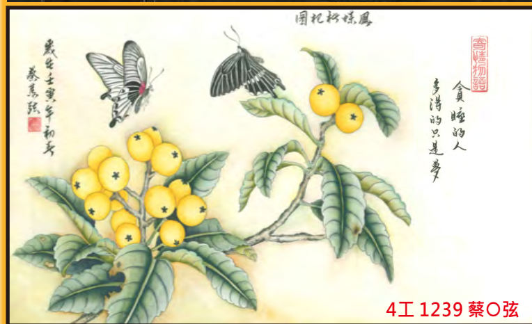
4工 1239 蔡○弦