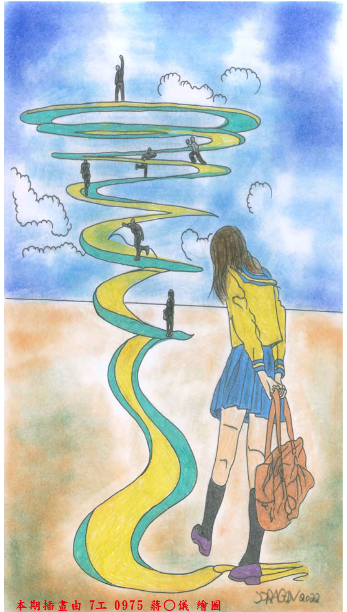
本期插畫由 7工 0975 蔣○儀 繪圖

人生如四季，春天是希望，夏天是壯麗，秋天是果實，冬天是反思，我們身處高牆內就有如在冬天，省思自己所為。若重新出高牆，你我能記取教訓否？青春已失、人生只有一次，我們要奮鬥，生命也只有一次，我們要珍惜，「人生的道路」，前半生風雲已過，後半生要好好把握，勿失志，記教訓、勿再沾染毒品，那是條不歸路、浪費我們美好青春與短暫的生命。願高牆內的同學共勉之。