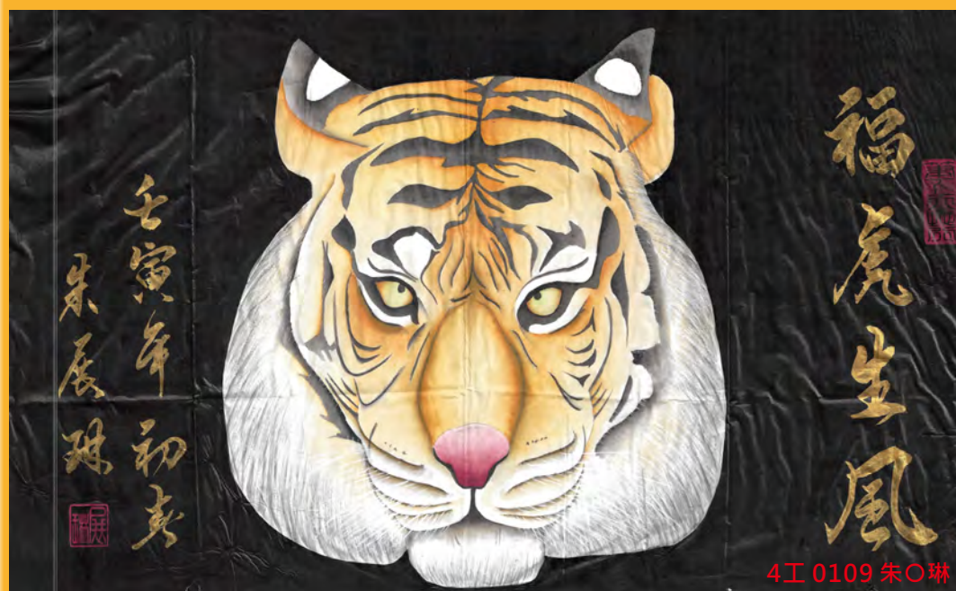
4工 0109 朱○琳