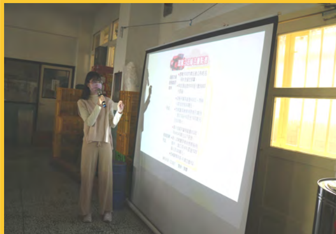
酒駕初級預防宣導