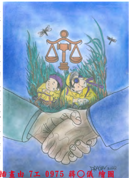
本期插畫由 7工 0975 蔣○儀 繪圖

看完後或許我的人生並不全如這般，但唯一相同的就是我也擁有一位非常愛我、苦苦等了我十五年的妻子，年輕時我總是時刻追求著名和利，想給她最好的生活、物質享受，而天天遊走在法律的邊緣賺取金錢，然而她卻也時常勸我回到正途，她寧可不要那些多好的生活或物質，只願平凡安定不用每天為我擔憂受怕，可是我卻執迷不悟、天天沉溺在黃、賭、毒中無法自拔、到最後卻落的二十年刑期，入監服刑至今十五年，看著妻子每星期從沒間斷只為來看我短短十五分鐘，我也才真正體會名和利再好、再多，又怎比的上愛我、關心我的家人，也是她讓我改變所有的價值觀，和對人生的意義，十五年的囹圄生活雖令我失去太多太多無法追回的人事物，但卻也令我猶如重生，我想我離開這時不是帶著遺憾，而是終於醒來、重獲新生，要開始我真真正正平凡、安定、幸福的人生下半場。