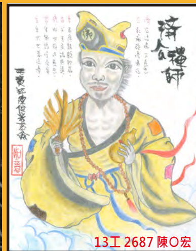
13工 2687 陳○宏