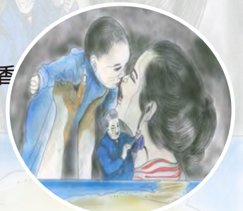
本期插畫由 7工 0975 蔣○儀 繪圖

時光流淌 花開花謝間 彷彿看見了 母親百髮如雪 哀愁的眼神 落寞而滄桑 彷彿嗅著了 母親髮上桂花香 剎時回到了 母親的懷裡 那是一片 寬廣的海洋 安心而自在