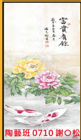
陶藝班 0710 謝○松