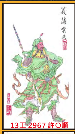
13工 2967 許○順