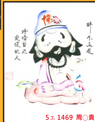
5工 1469 周○貴