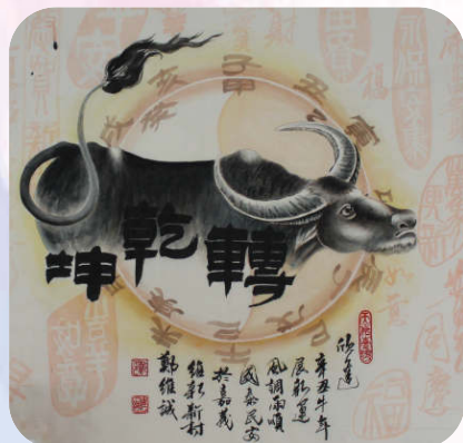
創意書法第一名(牛轉乾坤)