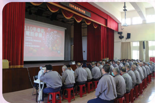
春節收容人電話孝親