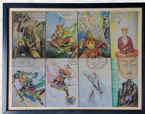
9月份收容人文康活動 「歷史(神話)故事漫畫比賽」(二)