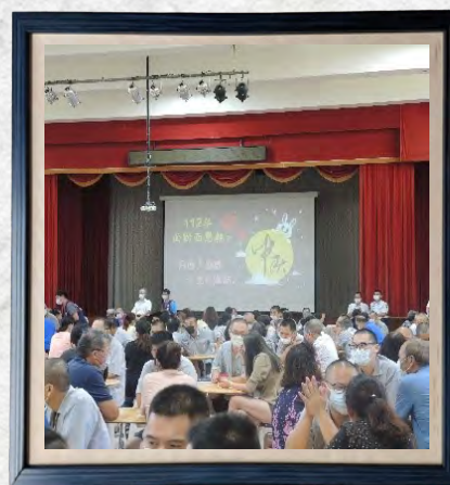
112年中秋節收容人面對面懇親活動