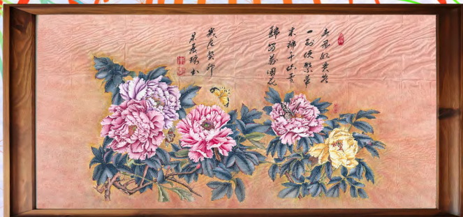
4工 0109 朱○琳