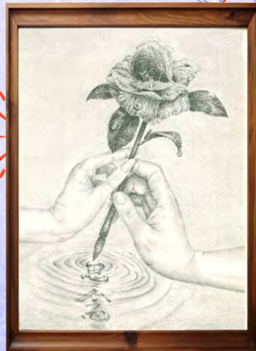
5工 1898 劉○智