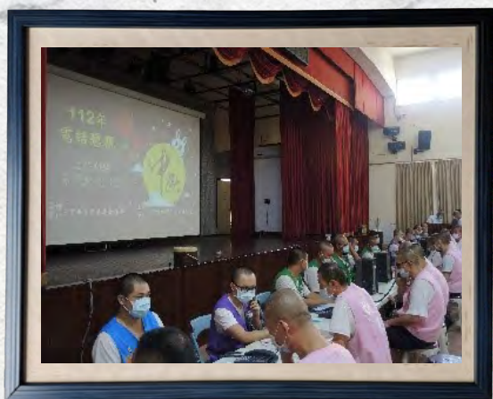
112年中秋節收容人電話孝親活動