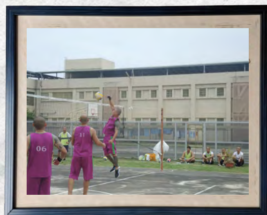
10月份收容人文康活動「排球比賽」