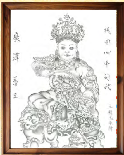
13工 3378 王○忠