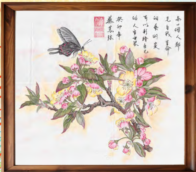
4工 1239 蔡○弦