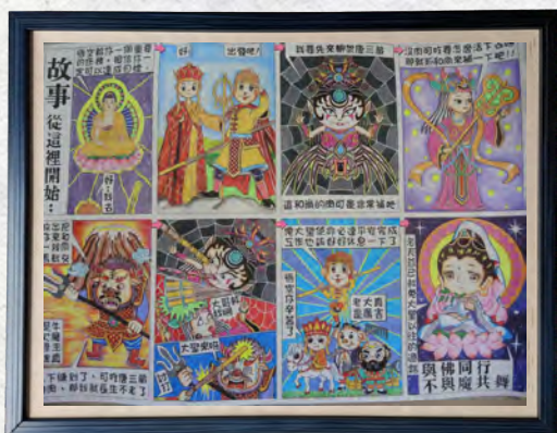
9月份收容人文康活動 「歷史(神話)故事漫畫比賽」(一)

112年10月份收容人文康活動「排球比賽」，比賽結果： 第一名四工、第二名陶藝班、第三名二工。