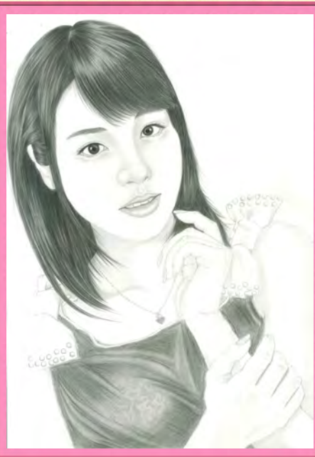
4工 1900 黃○舜