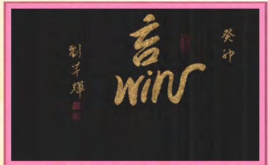
4工 1685 劉○輝