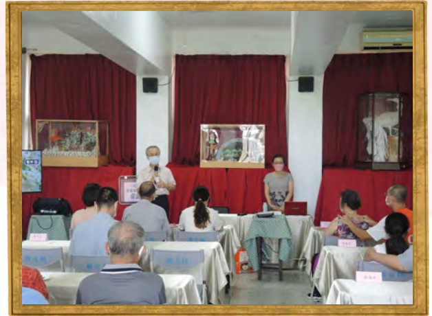
心靈點滴讀報班家庭日活動