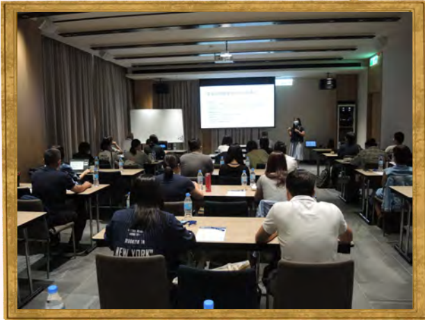
112年心理社會專業人員成癮及修復式司法研習課程