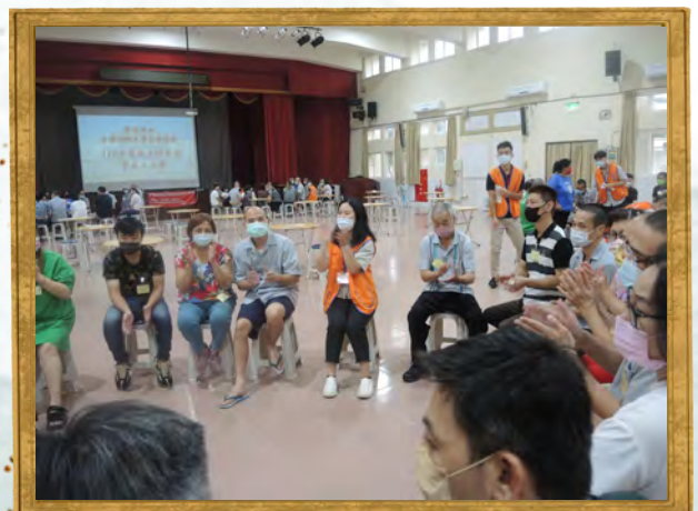
陽明教育事業基金會人員蒞監辦理 112年度收容人家庭支持方案家庭日活動