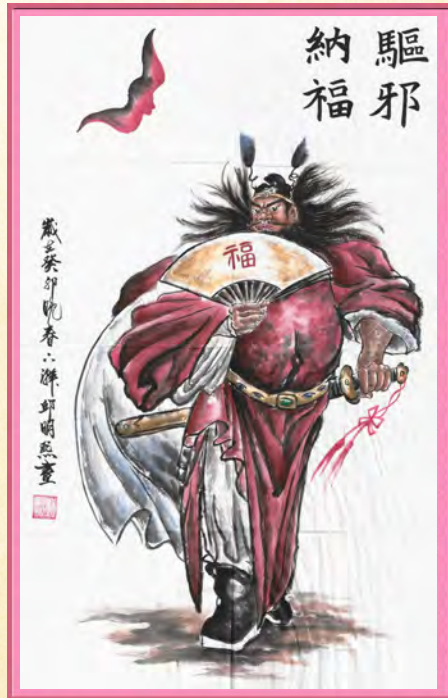
合作社 2865 邱○熙