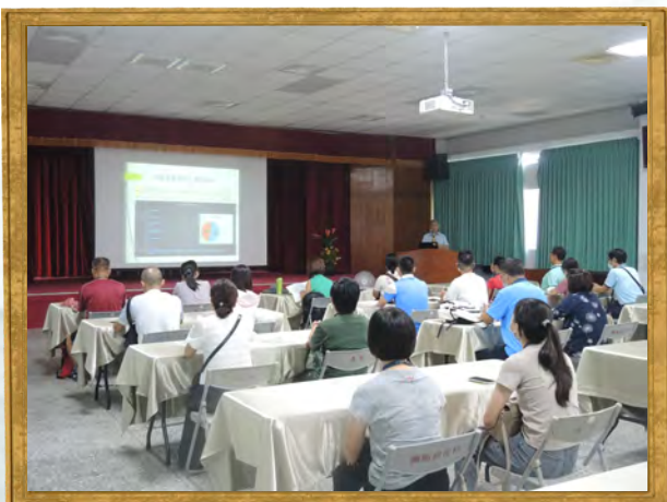
彰化縣毒品危害防制中心 預防宣導組蒞臨本監參訪