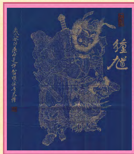
2工 2967 許○順