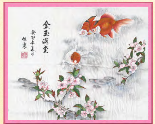
10工 0896 翁○憲