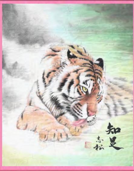
陶藝班 0710 謝○松