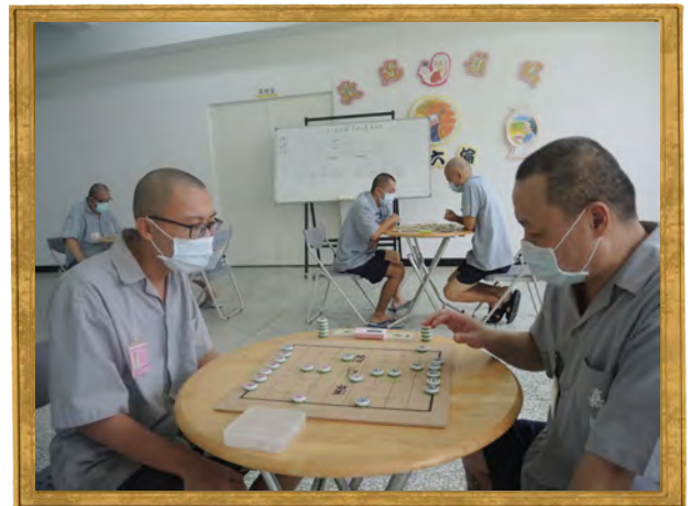
8月份收容人文康活動「象棋比賽」