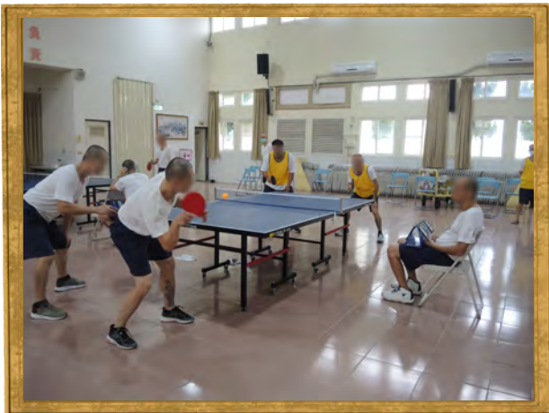
8月份收容人文康活動「桌球比賽」